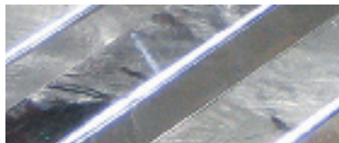
Nyförzinkat gods är ofta blankt.