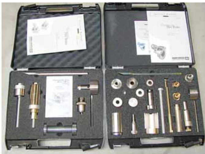
Verktyg för äldre ok

Det erfordras en verktygsväska för varje typ av bromsok. Det är ej kostnadseffektivt att komplettera de olika väskorna med lösa verktyg för att de skall fungera till de båda bromsokstyperna.